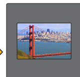
✓ Monterad i diaram